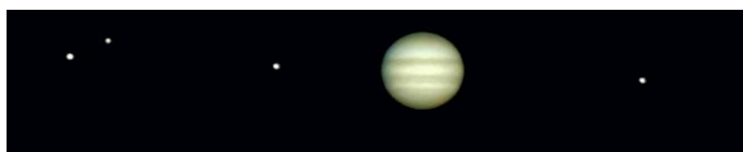
Satellites de Jupiter vus au télescope