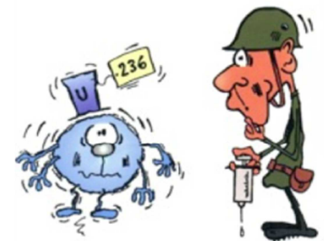
Alourdi d'un neutron, la victime devient très instable...

Après qu'on lui ait inoculé un neutron, le pauvre ^{235}\text{U} s'alourdit d'un nucléon, se transformant en ^{236}\text{U} , un gros lourdaud de la famille Uranium qui n'arrive plus à maintenir toutes ensemble les particules de son noyau. Comme une goutte d'eau qui devient trop grosse et se divise en deux gouttelettes plus petites, le pauvre ^{236}\text{U} éclate et se fragmente en deux noyaux plus petits (par exemple le krypton 92 et le Ba 141), expulsant en même temps deux ou trois neutrons rapides.