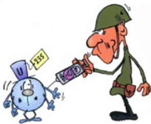
Le virus est un neutron.

L'Uranium 238 peut aussi être victime de la fission spontanée, une maladie heureusement beaucoup plus rare que la décroissance radioactive.