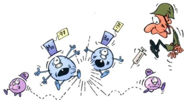
...puis se partage en deux atomes plus petits, libérant du même coup quelques neutrons. Cet accès brutal dégage beaucoup d'énergie.

Cette maladie produit environ 200 millions de fois plus d'énergie par atome éclaté que celle que peut produire une molécule dans la réaction chimique la plus violente ! Voilà donc un procédé bien séduisant pour se procurer de grandes quantités d'énergie !