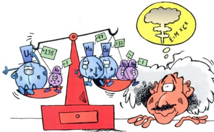
La maladie s'accompagne d'une légère disparition de masse.

Q12. Décrire le principe de la fission induite des atomes.